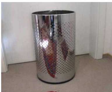
Abb. 10 (0001)