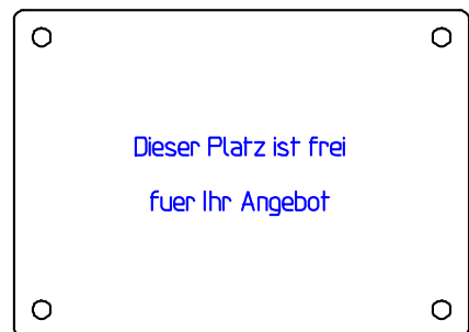
Abb. 12 (0155)