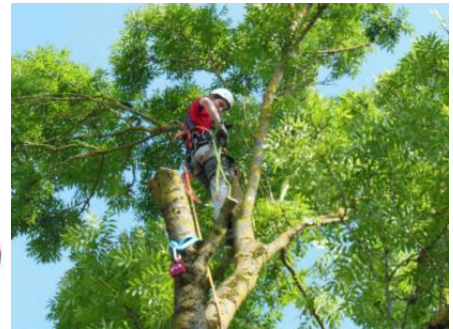
Abb. 6 (0006)