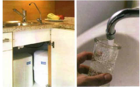
Abb. 3 (0049)