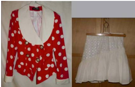
Abb. 1 (0347)