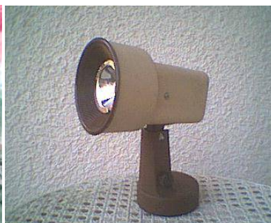
Abb. 14 (0001)