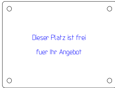
Abb. 2 (0001)