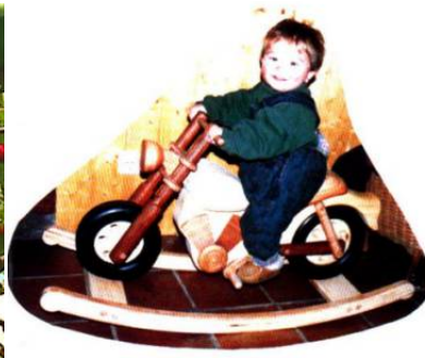
Abb. 5 (0006)