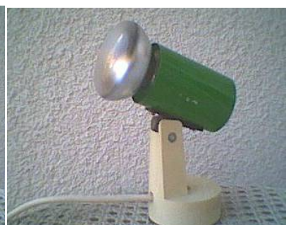
Abb. 15 (0001)